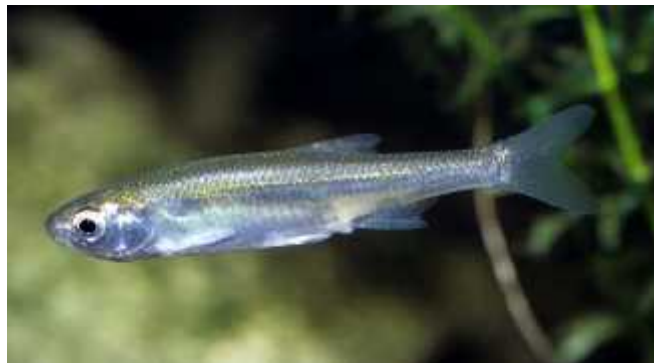
Slika 9 – belica ( Leucaspis delineatus ) ( http://www.biolib.cz/en/image/id112753/ )

Leti brzo i okretno na manje od 50 cm od površine vode na kojoj lovi kukce. Kada detektiraju plijen, lovi ga nogama i uz pomoć letnice oko repa ga prebacuje u usta. Jede gotovo sve životinje koje uspije uloviti na površini vode, pa čak i ribe belice (Slika 9). (Dietz i sur., 2009.)