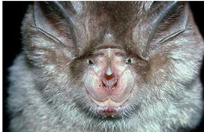
Slika 2 - nos potkovnjaka ( http://www.bio.bris.ac.uk/research/bats/China%20bats/images/china-031%20R.%20ferrumeiquinum.jpg )

Eholokacijski signali dosežu glasnoću čak i do 130 dB, pa šišmiši sami sebe oglušće u razdoblju dok ga ispuštaju i u tom razdoblju ne čuju eventualne povratne signale. Probleme također stvara činjenica da kukci „upiju“ dio zvuka, odnosno zvuk koji se odbija od kukca natrag prema šišmišu je 30-ak dB tiši od onog koji je šišmiš ispustio, dok je zvuk koji se odbija od većih objekata glasniji, pa šišmiš nije u stanju detektirati kukca. Zbog toga šišmiši moraju pažljivo tempirati trenutak ispuštanja signala. (Dietz i sur., 2009.)