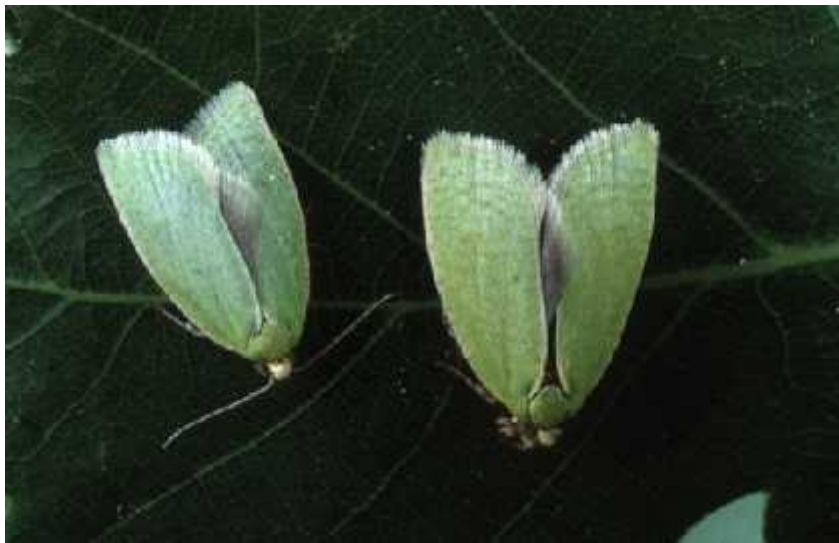
Slika 7 - Tortrix viridiana ( http://www.forestryimages.org/browse/detail.cfm?imgnum=2101020 )

Svi šišmiši našeg područja hrane se kukcima, ali svaka vrsta ima specifične kukce kojima se hrani. Upravo to omogućava da prilično velik broj vrsta živi na području Europe. Iako svaki šišmiš ima specifične kukce kojima se hrani, može doći do preklapanja, jer se često dogodi da je jedna vrsta kukaca posebno brojna na nekom području kao što je to leptir Tortrix viridiana (Slika 7) u hrastovim šumama ili mravi koji se skupljaju u borovim šumama mediteranskog područja u doba kada su seksualno aktivni. (Dietz i sur., 2009.)