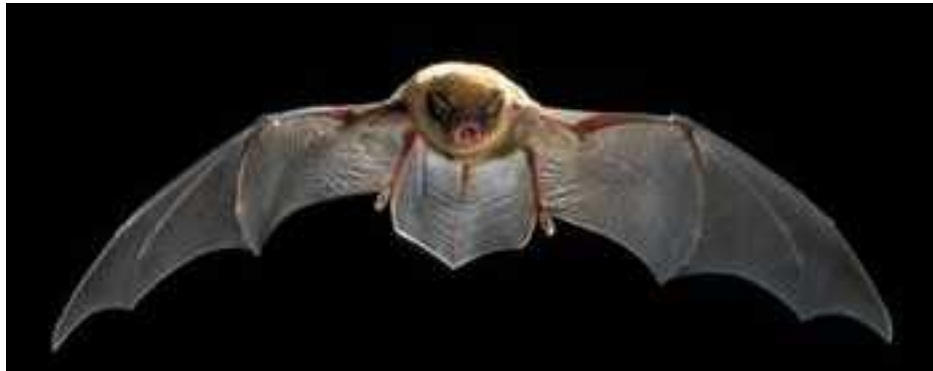
Slika 10 - Miniopterus schreibersii

Hrani se malim kukcima, gotovo isključivo s noćnim leptirima i ponekad dvokrilcima. (Dietz i sur., 2009.)