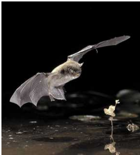
Slika 6 - lov nad vodom ( http://jeb.biologists.org/content/204/22/F1.medium.gif )