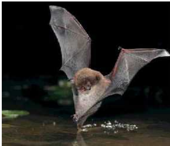
Slika 5 - hvatanje nogama ( http://www.cornwall-batgroup.co.uk/m_daubentoni.jpg )

Na površini vode prilično je lako detektirati kukca eholokacijom, jer se eholokacijski signal koji stigne na površinu vode pod kutem različitim od 90° odbija u pravcu suprotnom od šišmiša, a od kukca se odbije prema šišmišu. Tako se love kukci koji su slučajno pali ili plivaju po površini vode. Još jedna velika prednost takvog lova je što s površine vode kukci ne mogu tako brzo pobjeći kao u zraku ili na tlu. Vrste koje tako love imaju stopala izvan letnice i duge nožne prste jer plijen hvataju stražnjim nogama i uz pomoć repne letnice (Slike 5 i 6). Na taj način lovi dio vrsta svojte Myotis . (Dietz i sur., 2009.)