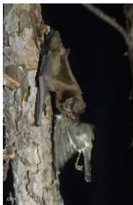
Slika 8 - N. lasiopterus jede pticu