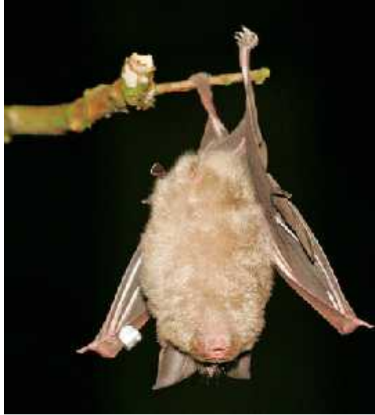
Slika 4 - R. ferrumequinum visi s grane