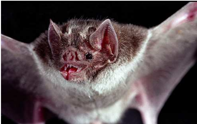
Slika 7. Šišmiš vampir Desmodus rotundus